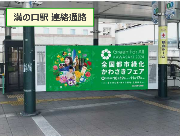
溝の口駅 連絡通路