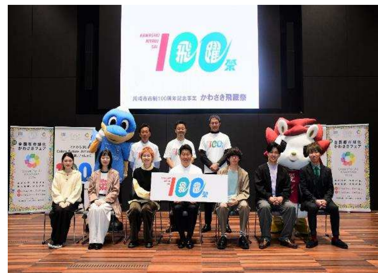
記者発表会登壇者の全体写真