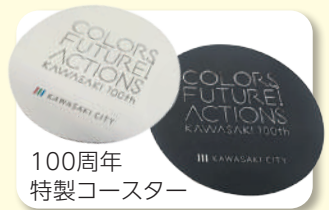
100周年 特製コースター