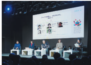
↑トークセッションの様子

市内3会場で行った川崎の未来を考える19のトークセッションと、市内各地で人気の17イベントをデジタルスタンプラリーで繋ぎ、川崎の魅力を再発見いただく回遊型フェスティバルを組み合わせて開催した「Colors,Future! Summit」。令和6年度は、今回以上に訪れる方が多様な楽しみ方ができるイベントにしていきたいです。