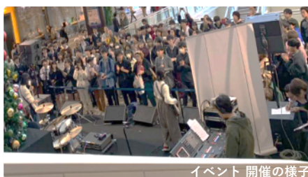
イベント開催の様子

市制100周年を迎える川崎の街で、川崎の未来をつくる若者を応援し、音楽を通して若者の「豊かな体験」を提供する場としてイベントを開催。また、令和6年市制100周年記念事業のプレイベント的な位置づけのイベントとして開催し、川崎の各企業様・団体様と連携しALL川崎で街と若者の接点を提供し、街の賑わい創出に貢献します。