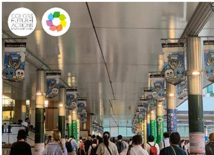
商店街・商業施設と連携した広告掲出