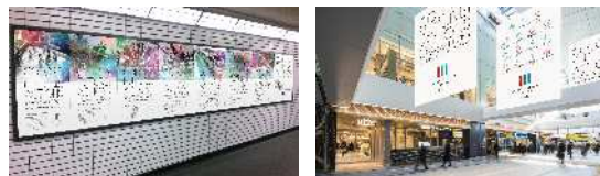
市が実施する「知ってもらう広報」 ※実施イメージ