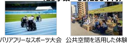
バリアフリーなスポーツ大会 公共空間を活用した体験