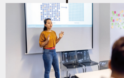
ピッチコンテスト