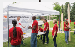
実行委員会ブース