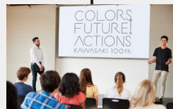
トークセッション