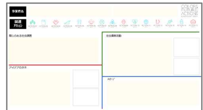
仮) Actionアイデアの種シートのイメージ